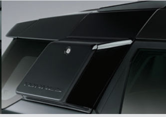
테일게이트 LED 램프 120,000원