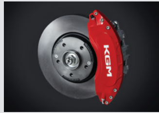
레드 알루미늄 캘리퍼 커버 300,000원

* 상기 품목은 취급 설명서 내 커스터마이징 품목 보증서에 따라 보증 적용됩니다.