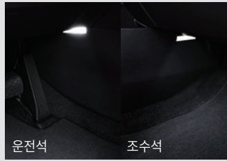
1열 풋램프 & LED 글로브 박스 램프 50,000원