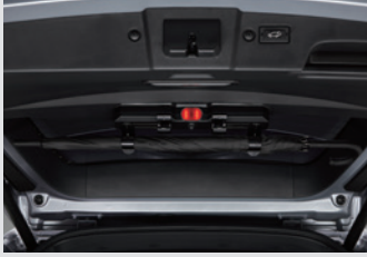
멀티 우산꽃이(우산꽃이 + 비상등 + 테일게이트 스팟램프) 150,000원