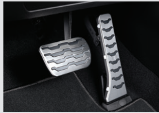
스포츠 페달 60,000원