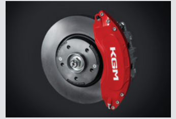
레드 알루미늄 캘리퍼 커버 300,000원