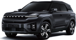
스페이스 블랙 LAK