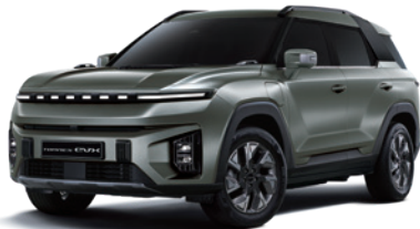
포레스트 그린 GAO