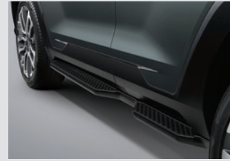
사이드 스텝 (좌/우) 450,000원