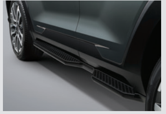
사이드 스텝(좌/우) 450,000원