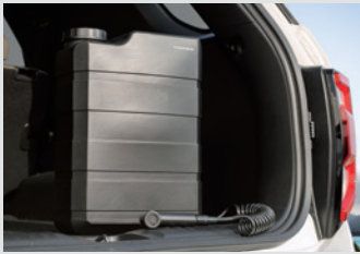
레이저 패키지 (아웃도어 워터탱크/휴대용 멀티 에어 컴프레서) 280,000원