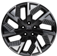
18인치 다이아몬드 커팅 휠