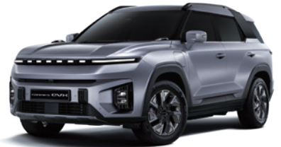
아이언 메탈 ADE