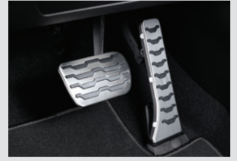
스포츠 페달 60,000원