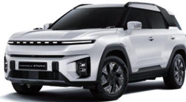
그랜드 화이트 WAA