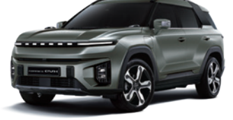
포레스트 그린 GAO