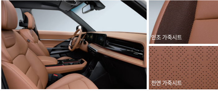
브라운 인테리어 (헤드라이닝 : 블랙)