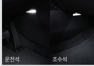
1열 풋램프 & LED 글로브 박스 램프 50,000원