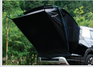
차박용 텐트 380,000원