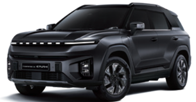
스페이스 블랙 LAK

* 본 가격표에 수록된 제품의 색상은 인쇄된 것이므로 실제 색상과 다소 차이가 있을 수 있습니다.