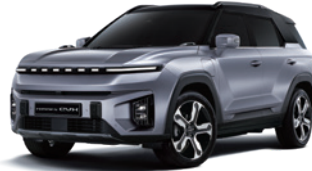
아이언 메탈 2DE