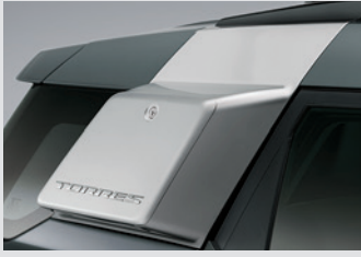
사이드 스토리지 박스(블랙 기본/실버 옵션) 300,000원