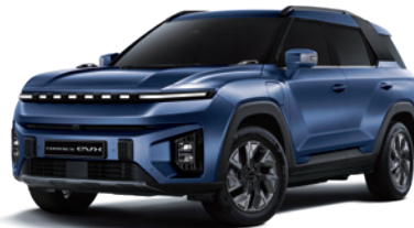
댄디 블루 BAS