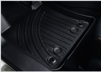
3D TPV 매트 (1열) 100,000원