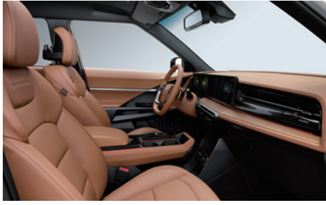
브라운 인테리어 (헤드라이닝 : 블랙)