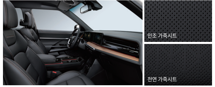
블랙 인테리어 (헤드라이닝 : 블랙)