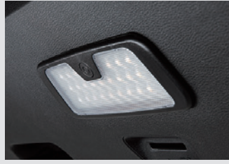
테일게이트 LED 램프 120,000원