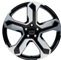
20인치 다이아몬드 커팅 휠