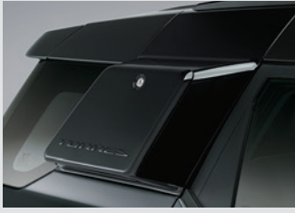
사이드 스토리지 박스(블랙) 300,000원