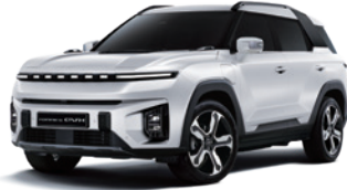
그랜드 화이트 WAA