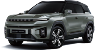
포레스트 그린 2GO

* 루프 / 스포일러 / C필러 : 블랙 컬러 * 투톤 선택 시 파노라마 선루프, 실버 컬러 C필러 가니쉬 선택 불가 * 본 가격표에 수록된 제품의 색상은 인쇄된 것이므로 실제 색상과 다소 차이가 있을 수 있습니다.