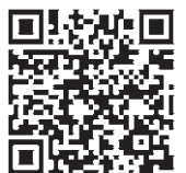
토레스 EVX 밴 모바일 페이지