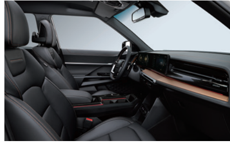
블랙 인테리어 (헤드라이닝 : 블랙)