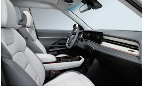
그레이 투톤 인테리어 [헤드라이닝 : 그레이 / 천연 가죽에는 지오닉 소재 적용(숄더 / 도어 센터 커버)]