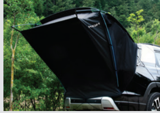
차박용 텐트 380,000원