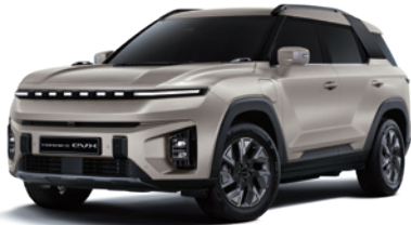
라떼 그레이지 EBL