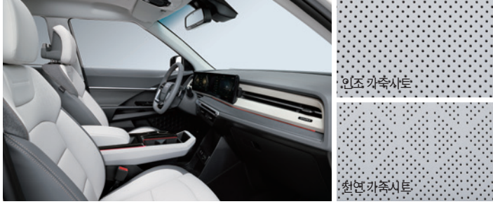
그레이 투톤 인테리어 [헤드라이닝 : 그레이 / 천연 가죽에는 지오닉 소재 적용(숄더 / 도어 센터 커버)]

* 지오닉 소재는 고기능성 소재로 내마모성, 내열성, 내오염성이 있는 특수 소재임