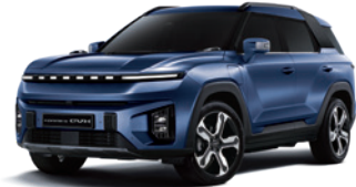
덴디 블루 BAS